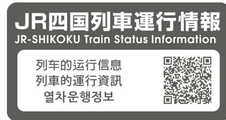
図3 掲出箇所の一例(5000系背面テーブル) 図4 座席背面テーブルに掲出するQRコード ※5000系グリーン席については座席背面テーブルに特急列車用を掲出。