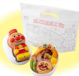
アンパンマン弁当 かわいい水筒付きのお弁当!