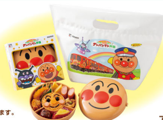
げんき100ばい! アンパンマン弁当