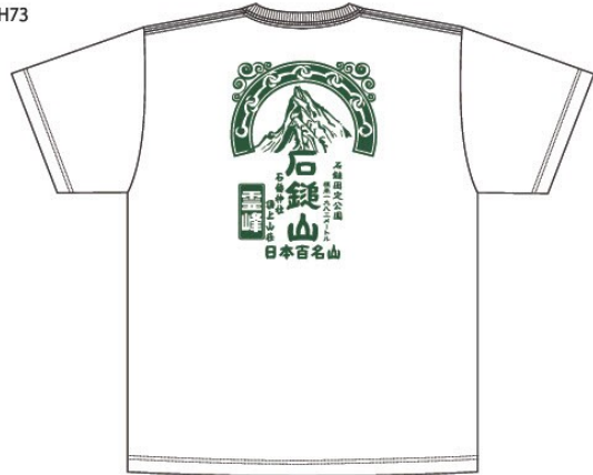
参考TシャツサイズM