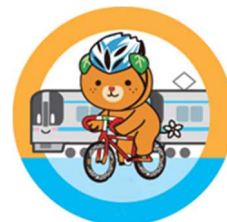
愛媛県イメージアップキャラクターみきゃん 許諾番号 401028