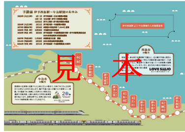
記念台紙 イメージ (ナカ)

※記念台紙サイズ (見開き) 縦 182mm × 横 257mm ※デザインは予告なく変更となる場合があります。