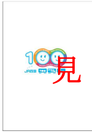
記念台紙 イメージ (オモテ)