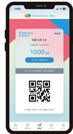
アプリ画面（イメージ）