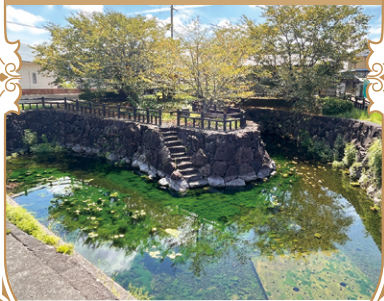
善通寺:二頭出水、市街地各所