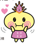
むぎゅ〜ちゃん 讃岐もち麦デザインモチをPRするために生まれた麦の妖精

善通寺駅では善通寺市長と観光大使「むぎゅ〜ちゃん」のお出迎え・記念撮影があります。