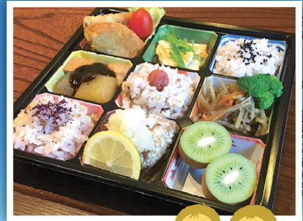
※香川大学キウイっこキャラクター ユニちゃん、プリちゃん