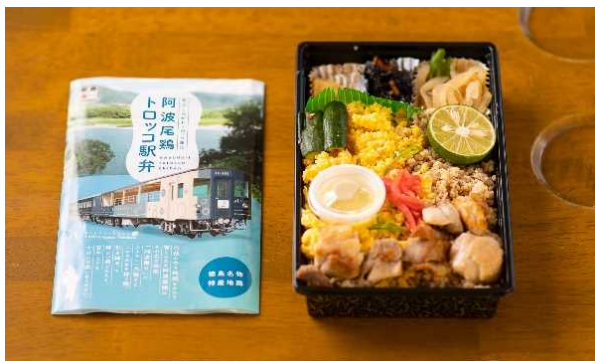
阿波尾鶏トロッコ駅弁 1,300 円(税込) 栗尾商店 (徳島県美馬郡つるぎ町)