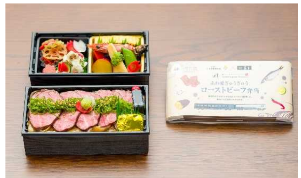
あわ愛ぎゅうぎゅう ローストビーフ弁当 3,200 円(税込) 日本料理 味匠 藤本 (徳島県三好市東みよし町)