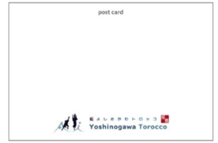
ポストカードイメージ (藍よしのがわトロッコオリジナル)