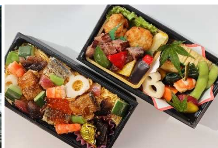
ツアー限定特製弁当