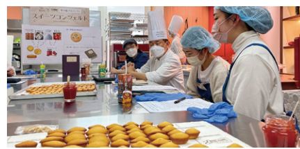
※掲載写真は全てイメージです