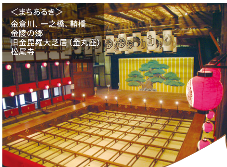
旧金毘羅大芝居(金丸座)

<まちあるき> 金倉川、一之橋、鞆橋 金陵の郷 旧金毘羅大芝居(金丸座) 松尾寺