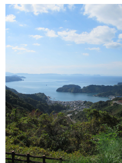
▲野福峠からの眺望