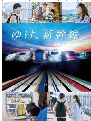
ポスター（イメージ）

スペシャルムービーはJRグループ Twitter 公式アカウントやYouTube でもご紹介しますので、是非ご覧ください！