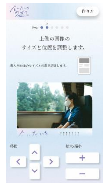
ポスターメーカー（イメージ）

Step3：ハッシュタグ「#会いたいをのせて」「#ゆけ新幹線」を付けて、オリジナルポスターを投稿。