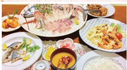
ゆきや荘・椿泊名物 「阿波水軍海賊料理」 2 昼食

※写真はイメージです。季節によって料理は異なります。※写真は3人前です。実際は個食での提供となります。