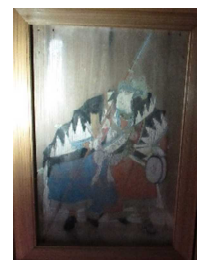
椿泊 佐田神社の絵馬