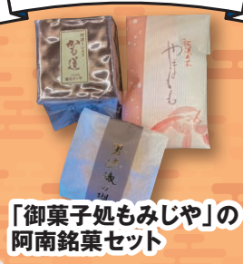
「御菓子処もみじや」の 阿南銘菓セット