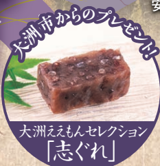
大洲市からのプレゼント 大洲ええもんセレクション「志ぐれ」