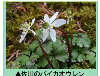
▲佐川のバイカオウレン