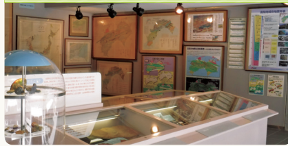
研究史コーナー (各地質図の変遷)