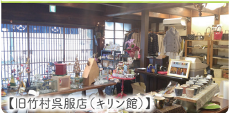
【旧竹村呉服店 (キンリン館)】