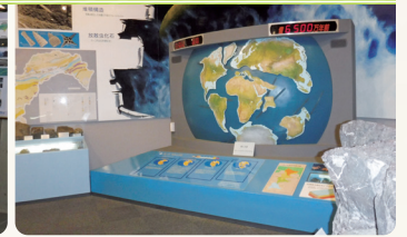
動く大陸装置 (プレートテクトニクス)