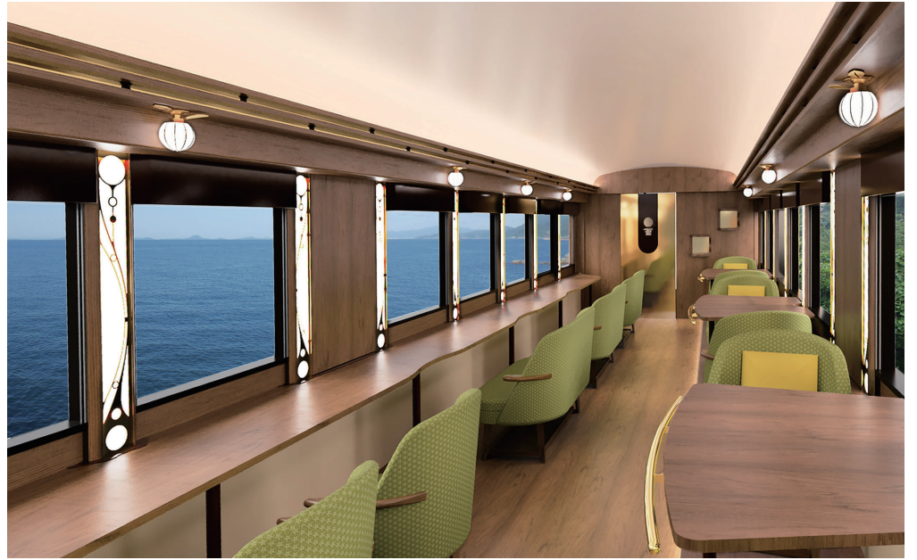
2号車「黄金の章」イメージ