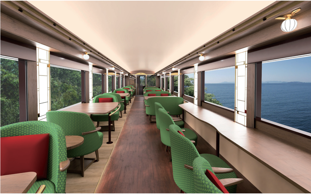
1号車「茜の章」イメージ