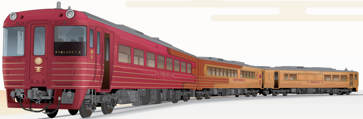
「伊予灘ものがたり」八幡浜側先頭イメージ