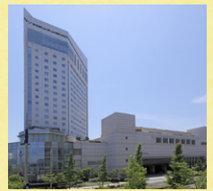
JRホテルクレメント高松