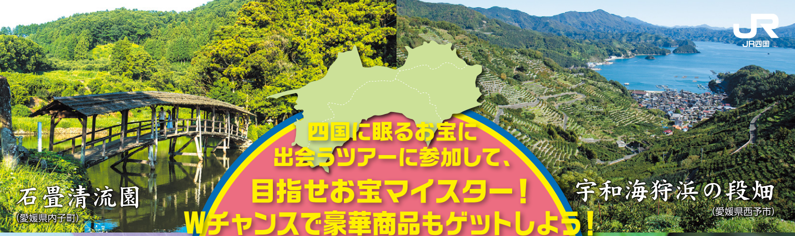
石畳清流園 (愛媛県内子町)