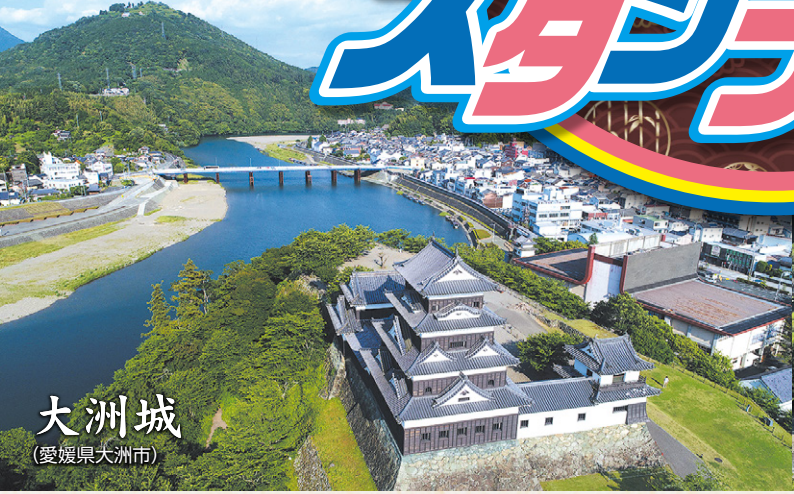
大洲城 (愛媛県大洲市)