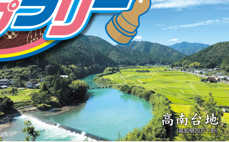
高南台地 (高知県四万十町)