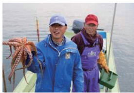
漁師のなわさんに 魚のことを教えてもらうよ！