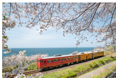
下灘駅付近の桜の様子