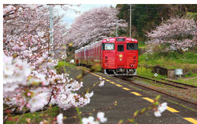
喜多灘駅の桜の様子

下灘駅付近、千丈駅付近での徐行に加え、喜多灘駅では全便停車し、駅ホームにて桜をご覧いただけます。