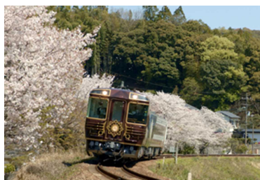
朝倉駅～伊野駅付近の桜の様子

※天候等の影響により桜の開花時期とイベント期間に差が生じる場合がございます。あらかじめご了承ください。写真はイメージです。