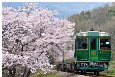
箸蔵駅付近の桜の様子