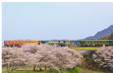
黒川駅～讃岐財田駅間の桜の様子