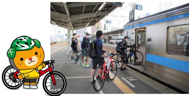
自転車をそのまま電車に持ち込みます