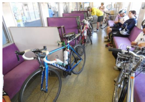
電車の旅を楽しみます♪