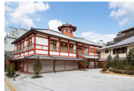
道後温泉別館 飛鳥乃湯泉

★ 協和酒造株式会社 酒蔵カフェはつゆき イートドリンク50円引き サイクルオアシス