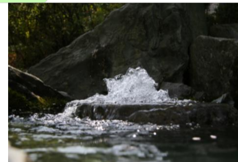
西条の名水「うちぬき」