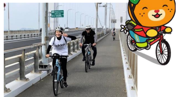
しまなみ海道サイクリングへ!