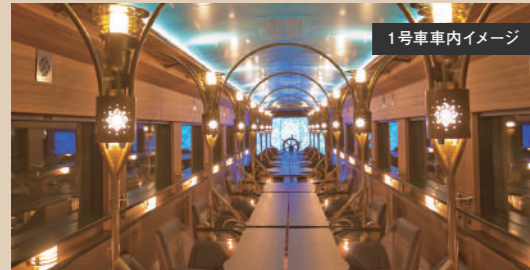
1号車車内イメージ