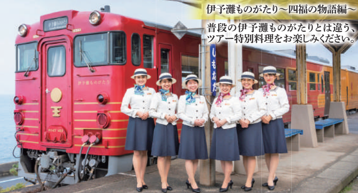
伊予灘ものがたり～四福の物語編～ 普段の伊予灘ものがたりとは違う、ツアー特別料理をお楽しみください。

四国まんなか千年ものがたり SHIKOKU MANNAKA SANNEN MONOGATARI