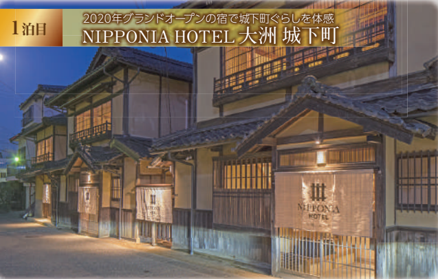
1泊目 2020年グランドオープンの宿で城下町暮らしを体験 NIPPONIA HOTEL 大洲 城下町

「NIPPONIA HOTEL 大洲 城下町」は、城下町をまるごとホテルに見立てた、故くて新しいホテルです。フロントや客室は、まさに点在する歴史的に価値の高い邸宅を快適に過ごせるようリノベーション。ご夕食は、大洲の恵まれた自然地形から生み出される数々の食の宝をアレンジしたフュージョン料理を、美しい砥部焼とともにお楽しみください。