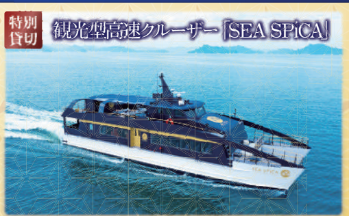
特別貸切 観光型高速クルーザー「SEA SPICA」

歌舞伎の演目「義経千本桜」に登場する「初音の鼓」からネーミングされた、天然温泉の露天風呂付の和洋室で心身ともに寛ぎください。