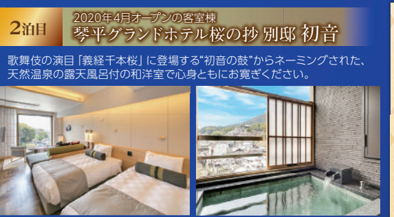
2泊目 2020年4月オープンの客室棟 琴平グランドホテル桜の抄 別邸 初音

歌舞伎の演目「義経千本桜」に登場する「初音の鼓」からネーミングされた、天然温泉の露天風呂付の和洋室で心身ともに寛ぎください。