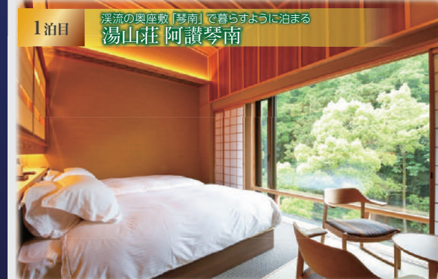
1泊目 溪流の奥座敷「琴南」で暮らすように泊まる 湯山荘 阿讃琴南

阿讃山脈の懐に抱かれた、静謐なる自然に佇む里山の別荘「阿讃琴南」。別荘へと誘う時架ける橋を渡ると、里の趣と暖かや開けの温もりに包まれた理想の休日が始まります。自家源泉を湛える森に抱かれた河畔風呂「せせらぎ」ではバリエーション豊かな露天風呂が楽しめます。お食事は阿讃の大自然に育まれた食の数々を取り入れた、野趣溢れる里山料理をご堪能ください。