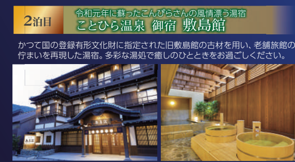
2泊目 令和元年に蘇ったごんざんさんの風情漂う湯宿 ことひら温泉 御宿 敷島館

かつて国の登録有形文化財に指定された旧敷島館の古材を用い、老舗旅館の佇まいを再現した湯宿。多彩な湯処で癒しのひとときをお過ごしください。