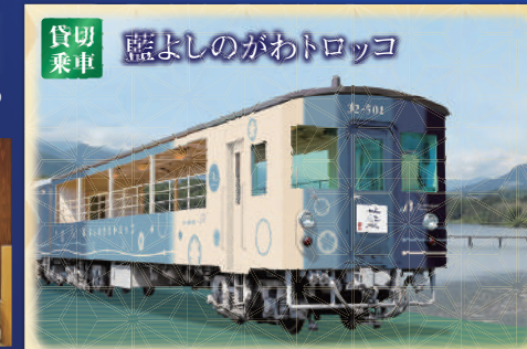
貸切乗車 藍よしのがわトロッコ

かつて国の登録有形文化財に指定された旧敷島館の古材を用い、老舗旅館の佇まいを再現した湯宿。多彩な湯処で癒しのひとときをお過ごしください。