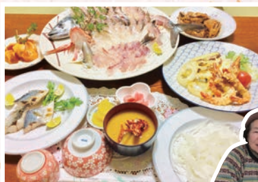
ゆきや荘・椿泊名物 昼食 「阿波水軍海賊料理」