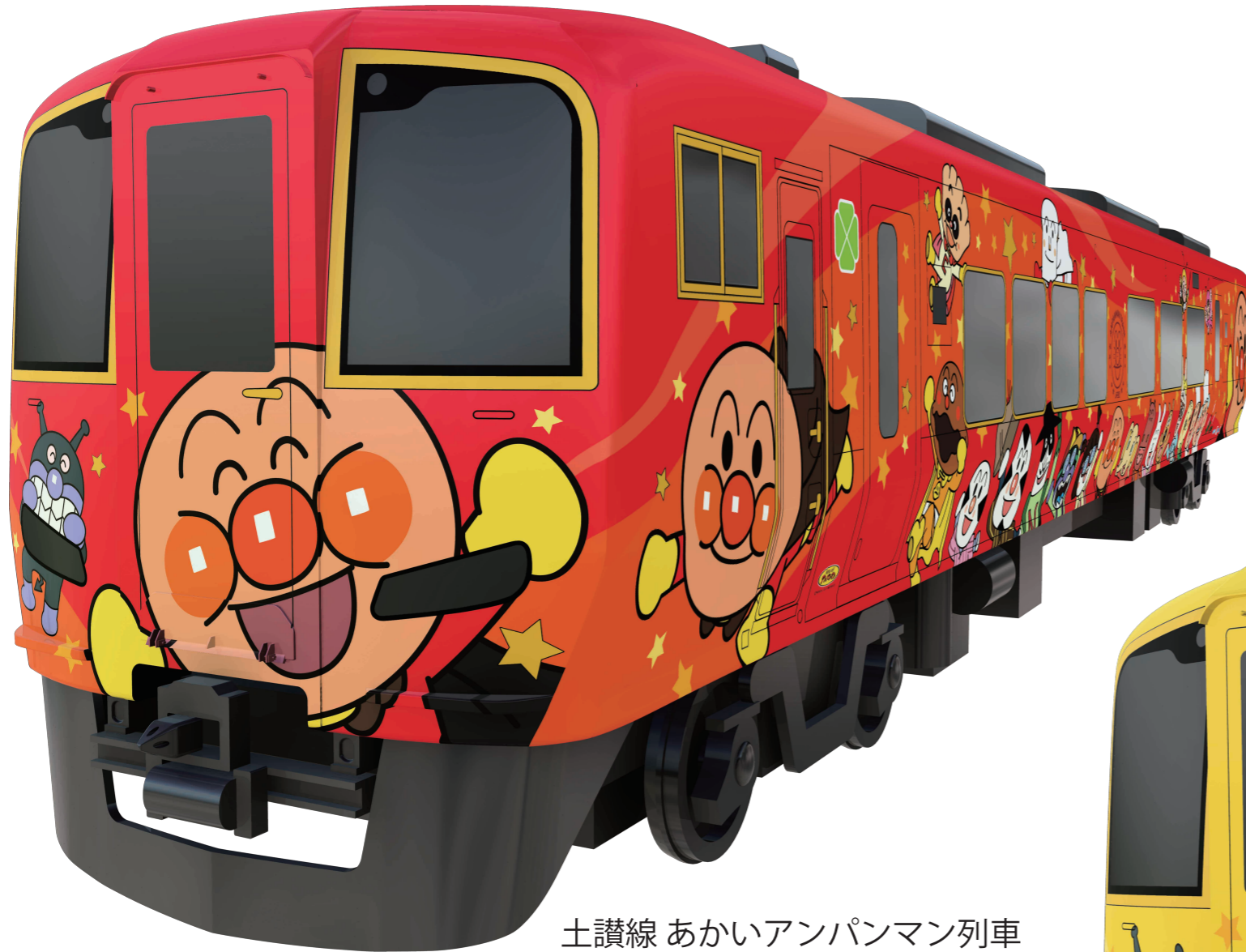
土讃線 あかいアンパンマン列車