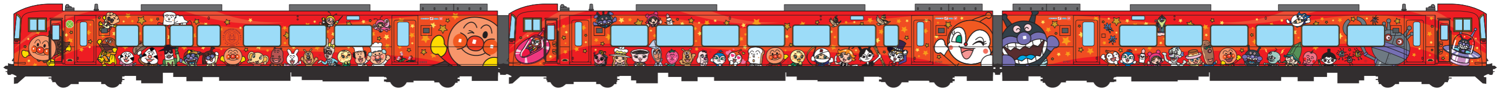
アンパンマンシート 装備車両 Msc