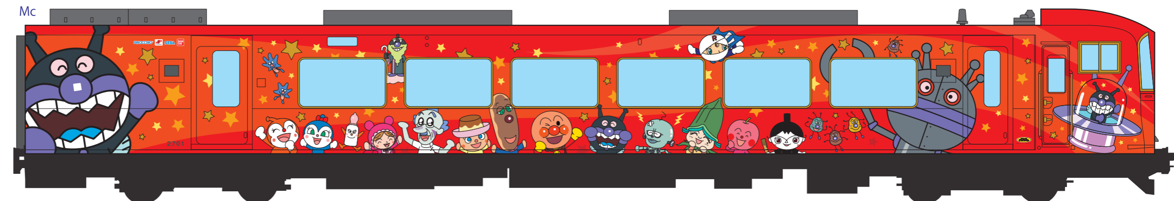
ばいきんまんなかまたち