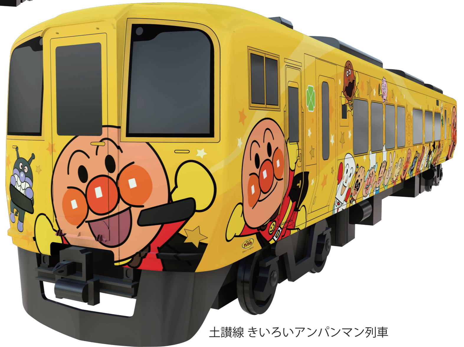
土讃線 きいろいアンパンマン列車