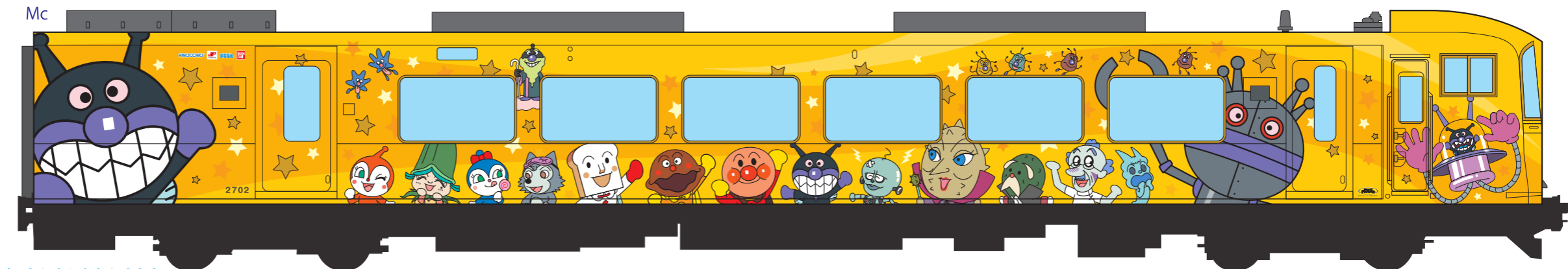
ばいきんまんなかまたち