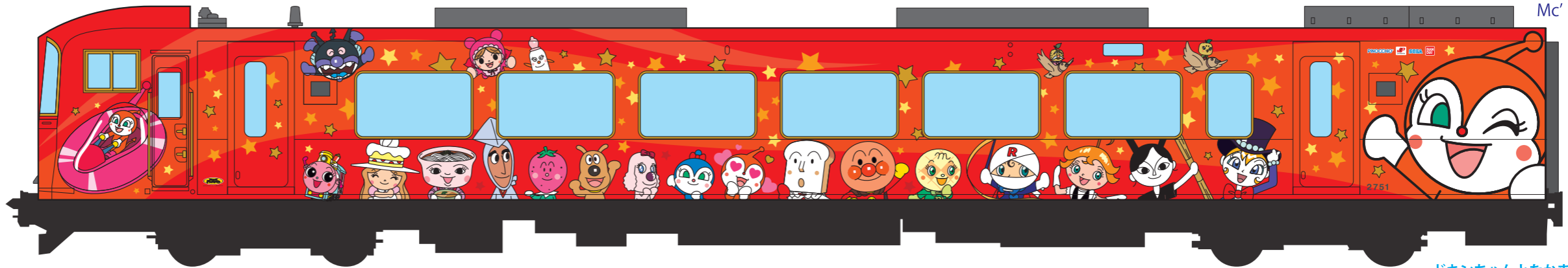
ドキンちゃんとなかまたち