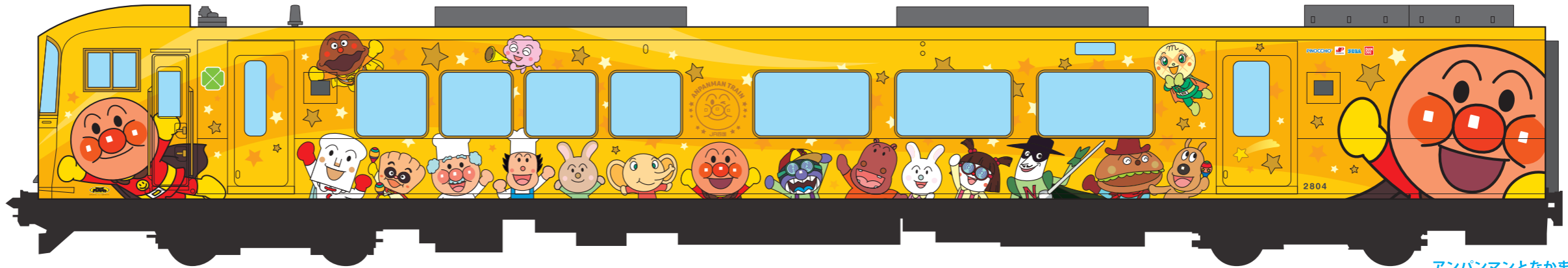
アンパンマンとなかまたち