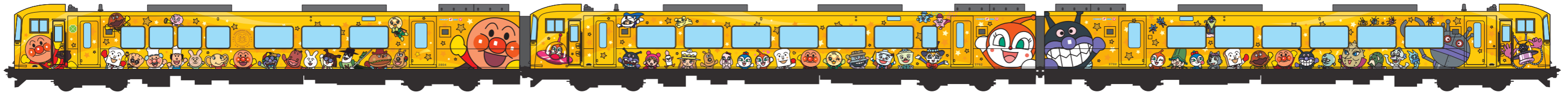
アンパンマンシート 装備車両 Msc