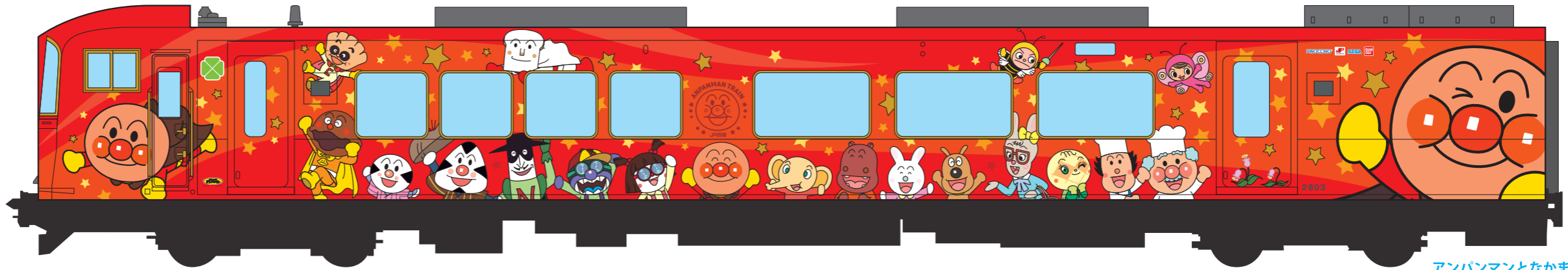
アンパンマンとなかまたち