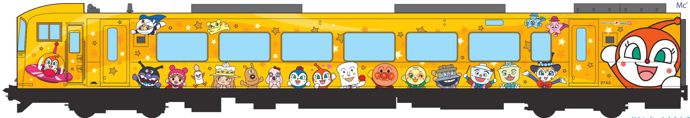
ドキンちゃんとなかまたち