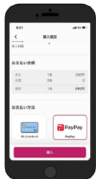
スマえき専用ホームページ