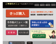
従来のトップ画面